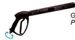
GH 351 gun with Swivel (n.2 o-ring) Pistola GH 351 con Swivel (n.2 o-ring)

STANDARD ACCESSORIES › DOTAZIONE STANDARD