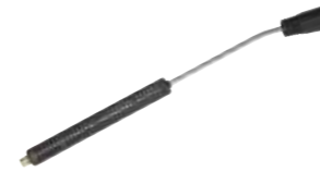
Bent lance with detergent head, without nozzle Lancia angolata con testina detergente, senza ugello