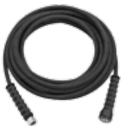
8 m R1-1/4" delivery rubber hose kit Kit tubo gomma mandata 8 m R1-1/4"