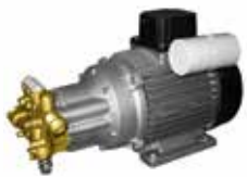
MTP KLR Gold

Idropulitrici elettriche ad acqua fredda