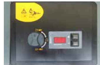
Control panel with 2 position rotary switch (pump / boiler) + temperature regulation (max 180° C) + alarms

Attacco posteriore per pistola elettrificata e rubinetto scarico vapore/ingresso acqua