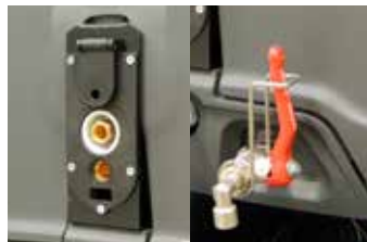
Rear attachment for electrified gun and steam outlet/water inlet tap

Serbatoio detergente 3,5 lt con possibilità di aspirare da tanica esterna