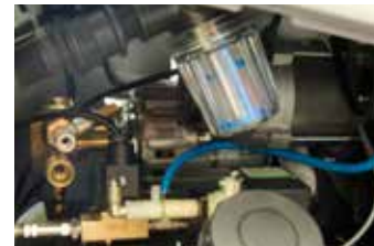
Practical access door to water filter and fill/inspection water tank cap

Manometro pressione vapore 0-16 bar con cassa in inox