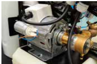
Motorpump unit for feeding water into the boiler

Gruppo motopompa alimentazione acqua in caldaia