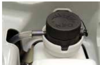
3.5 lt detergent tank with possibility to suction from external tank

Rubinetto miscelazione vapore/acqua calda