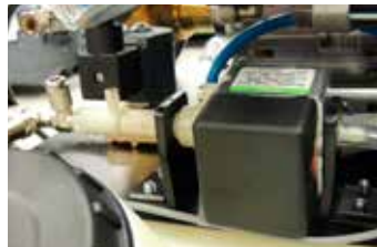
Pump for the automatic dosage of detergent

Gruppo motopompa alimentazione acqua in caldaia