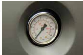
Steam pressure gauge 0-16 bar with stainless steel case

Manometro pressione vapore 0-16 bar con cassa in inox