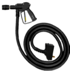
Steam gun with 10 mt hose Pistola a vapore con tubo 10 m