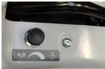
Steam/hot water mixing tap

Pratico sportello di accesso a filtro acqua e tappo rabbocco/ispezione serbatoio acqua