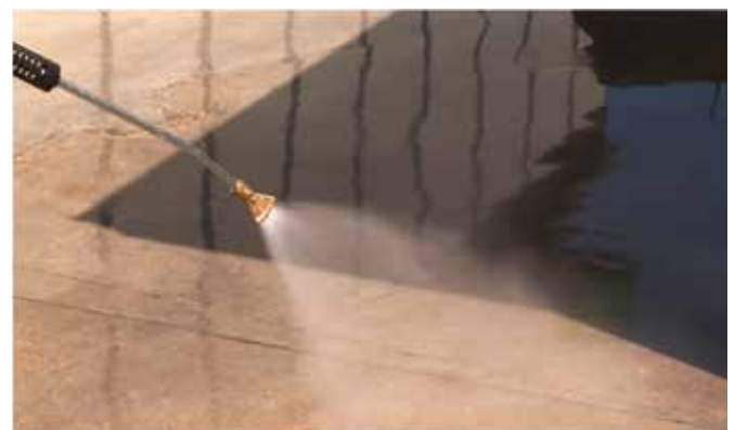
STEAM VAPORE 8 l/min - 32 bar (140° C)