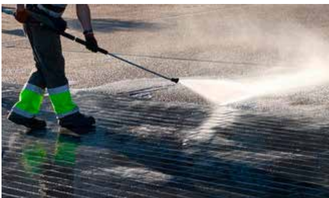
HOT WATER CLEANING LAVAGGIO ACQUA CALDA 21 l/min - 160 bar (85° C)