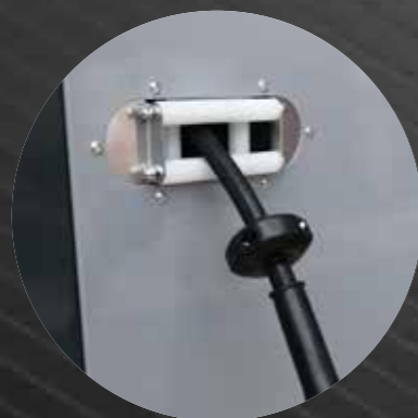
Cover equipped with anti-rubbing hose guide

Avvolgitubo automatico in acciaio verniciato e tubo alta pressione da 20 m (su modelli extra)