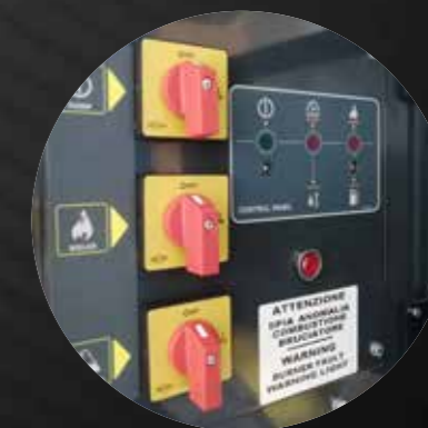
Control panel with three on/off switches and led alert

Cisterna acqua con galleggiante di livello e caricamento