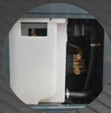
Access door for easy maintenance

Sportello di accesso per facilitare le operazioni di manutenzione