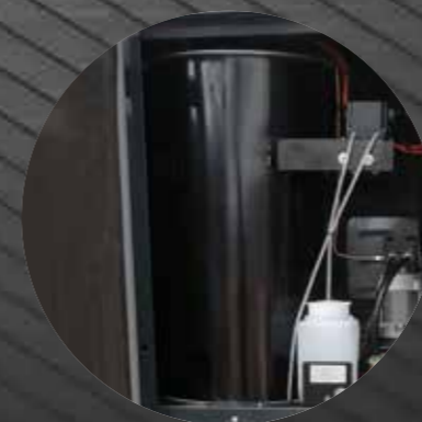
Vertical diesel-fueled boiler