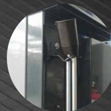
Lance holder with loop attachment

Supporto portalancia con aggancio a cappio