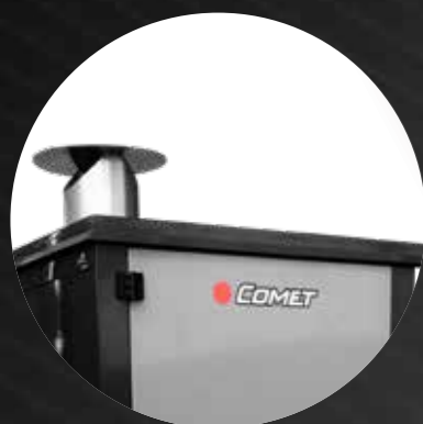
Chimney with stainless steel rainproof roof

Versatile, performante e comodo da usare