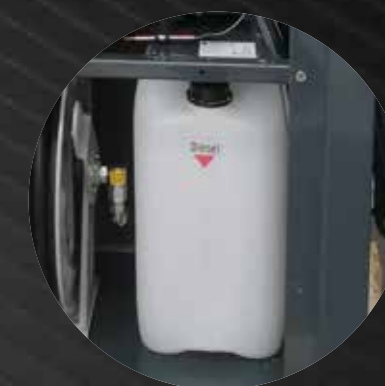
25-liter diesel tank with level indicator

Supporto portalancia con aggancio a cappio