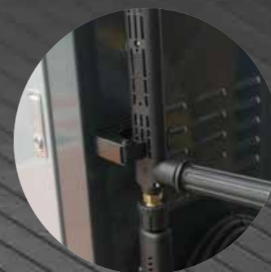
Practical storage of the gun

Sportello di accesso per facilitare le operazioni di manutenzione