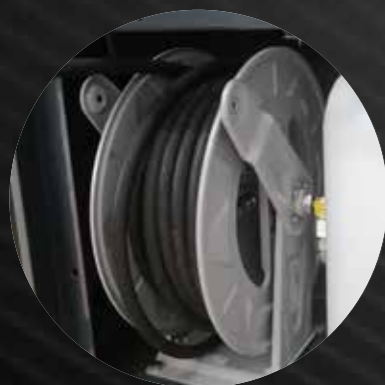
Automatic painted steel hose reel and 20m high pressure hose (only on extra models)

Serbatoio gasolio da 25 litri con indicatore di livello