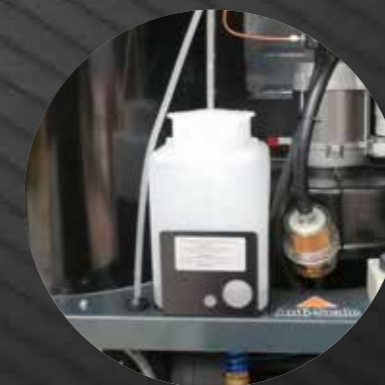
Water tank with level and filling float

Cisterna acqua con galleggiante di livello e caricamento