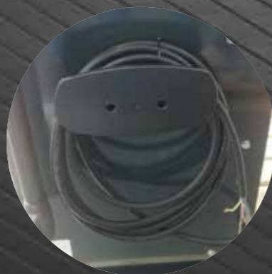
Power cord holder

Cover equipaggiata con guidatubo antisfregamento